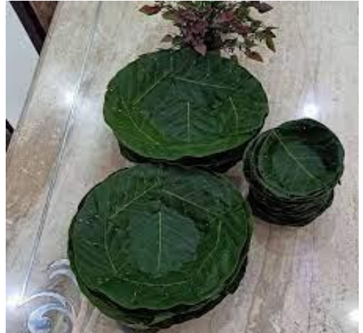
सालका पातको टपरी

बाँसको चोया काटेर डोको डालो बनाउने, पातबाट टपरी दुना बनाउने र परम्परागत रूपमा गरिने अन्य यस्ता धेरै प्रकारका कार्यहरू हाम्रो घरायसी जीवनका अत्यन्त आवश्यक पर्ने वस्तुहरूको उत्पादन गर्नमा सहायक सिद्ध भइरहेका छन् । एक पुस्ताबाट अर्को पुस्तामा परम्परागत रूपमा प्रविधि हस्तान्तरण हुने यसप्रकारका पेसाहरूमा विशेष तालिम परिश्रम लगानी गरेको नदेखिए तापनि यसको आफ्नै महत्त्व र औचित्य रहेको प्रष्टसँग