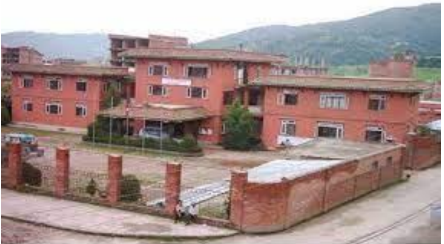
बनेपा नगरकार्यपालिकाको कार्यालय

बनेपा नगरपालिकाले पनि सर्वसाधारणको दैनिक जीवनसँग प्रत्यक्ष सरोकार रहेका सेवाहरू स्थानीय तहबाट वितरण गर्ने गर्दछ ।